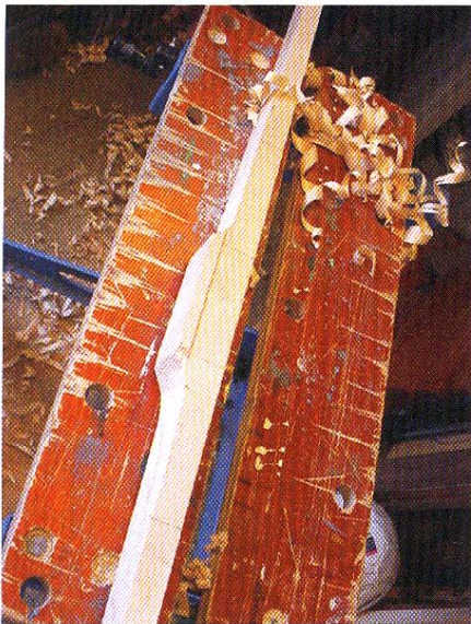
Flatbow na meten, zagen en schaven...

Nee, zo'n vizier op je boog staat misschien wel leuk, maar het is geen garantie om altijd maar in het geel te schieten. Mij leverde dat steeds meer stress op. Een boog met alles er op en er aan en dan een resultaat dat niet naar wens is!