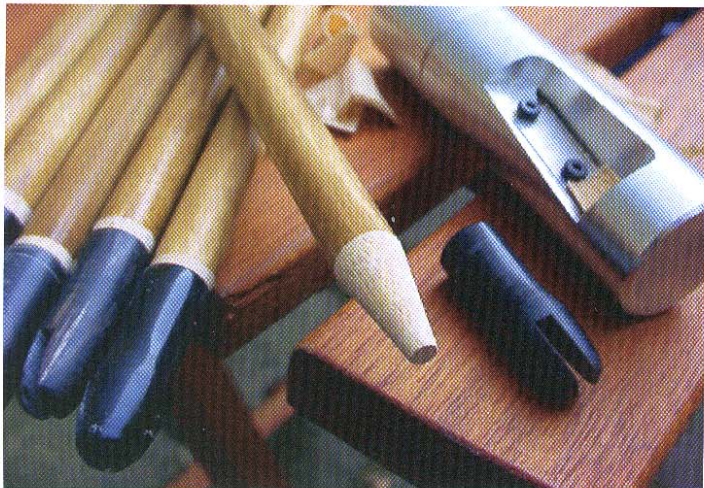
Plaatsen hoornen nokken

kunnen. Elfen en Uruk-Hai boogschutters komen volop in actie. Voor wie dit alles volkomen vreemd overkomt, kan ik alleen maar zeggen: "Ga de films (video/DVD) bekijken... een hele zit